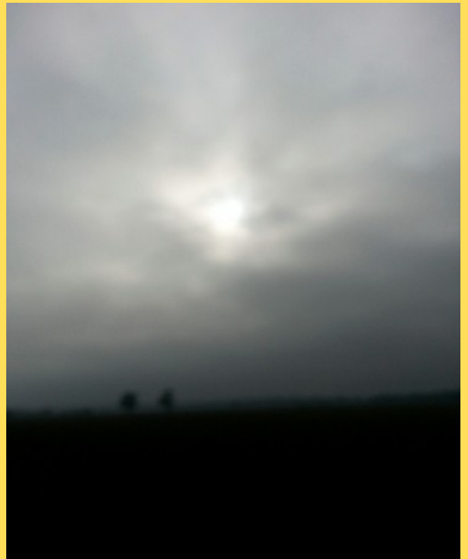
un soleil flotté dérive le long d'une aube laiteuse